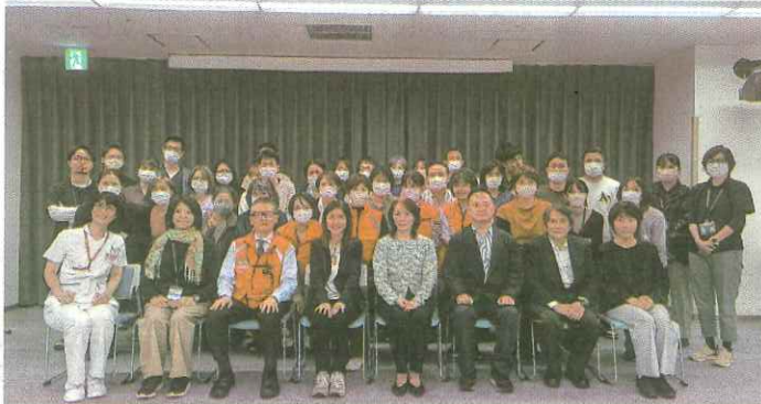
県立大島病院での訓練参加者