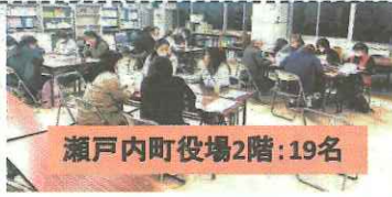
瀬戸内町役場2階: 19名