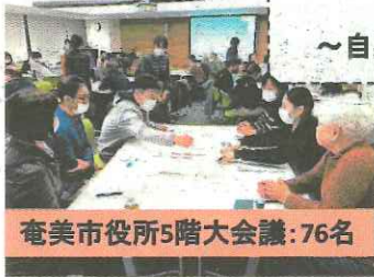
奄美市役所5階大会議: 76名