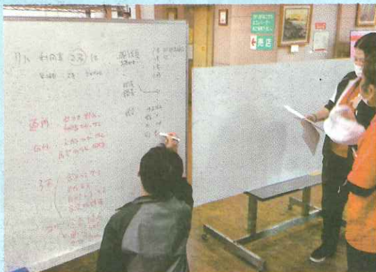
発生時の初動対応の様子

3月18日(水)17時15分より、震度6強の直下型地震発生を想定したBCPシミュレーションを実施しました。想定は「平日の午後2時45分に直下型地震が発生、停電が起き、窓の破損や転倒によるけが人が施設内に発生」という状況です。BCPの取り決めに従い対策本部を1階事務所に設置。ホワイトボード2枚を用いて各部署からの情報を集約し、指示伝達を行う流れを実際に体験しました。各部署が自部署の安全を確認して本部へ報告し、ヘルプに動ける職員が本部へ集合して