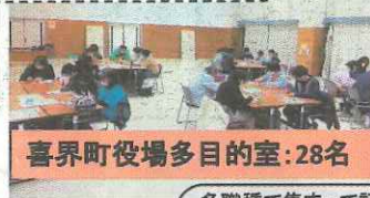
喜界町役場多目的室: 28名